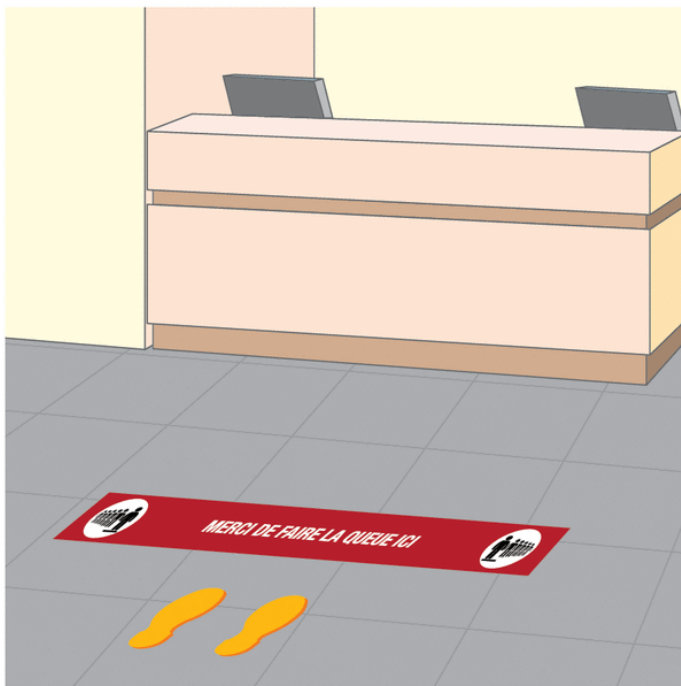
Marquage au sol