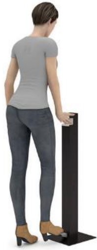
Mécanique avec pédale