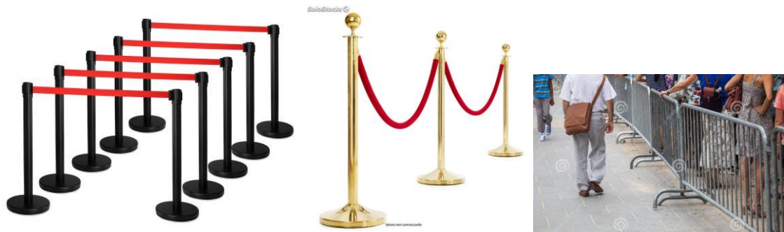
Séparateur d'allée / guide file / barrière / cordon