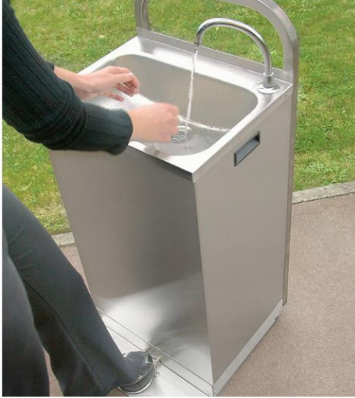
Evier à pédale