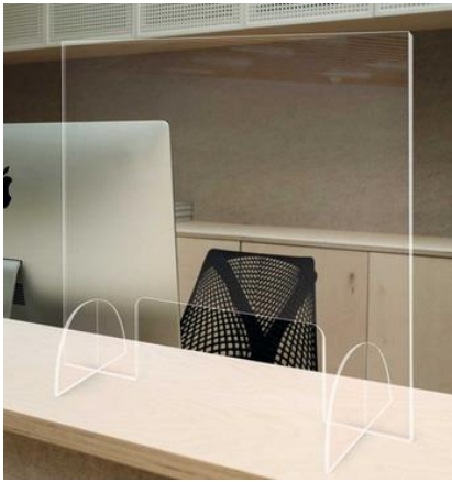
Plexi pour accueil

(isoler le poste de travail des contacts avec d'autres personnes)