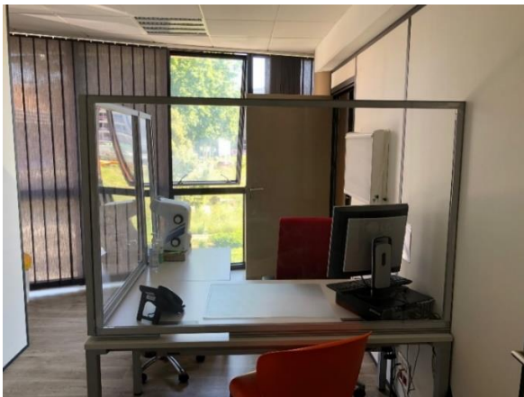
Box individuel bureau