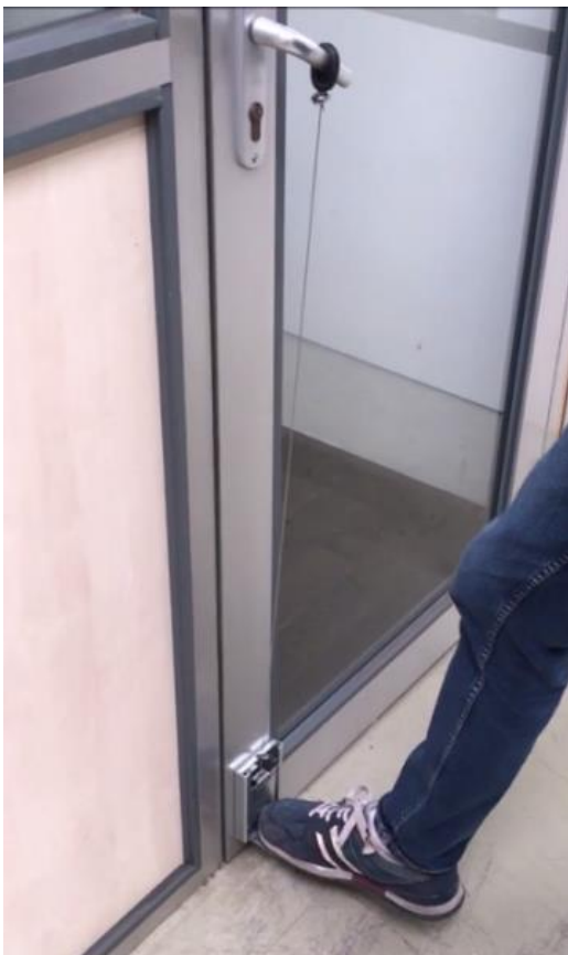
Ouverture avec le pied