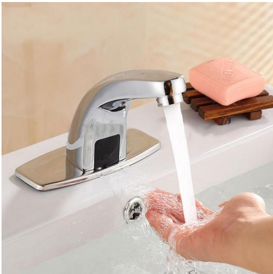
Evier sans contact