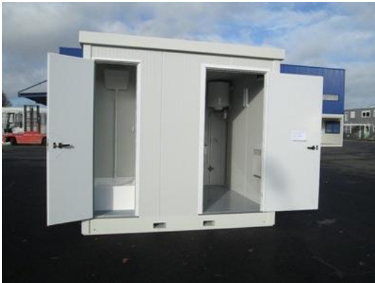
Locaux additionnels et temporaires