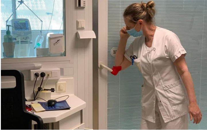
Ouverture avec le coude