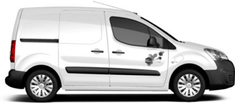
Location véhicule (1 pers. par voiture)

Sous conditions d'aménagement de mesures de protection collective, les masques peuvent également être pris en compte