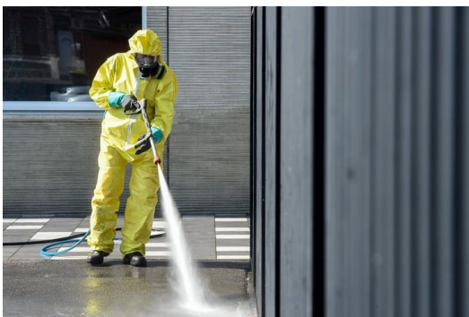
Ménage/désinfection des locaux