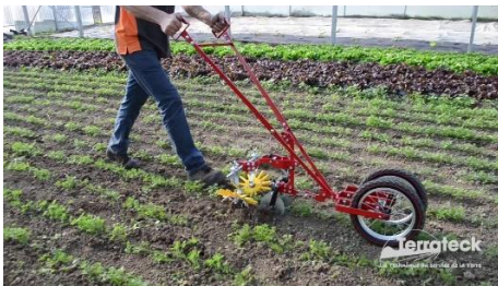
Doublement matériel (1 outil par pers.)